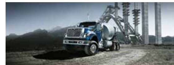
Foto de referencia Nota: las especificaciones y descripciones de este material son las más exactas al momento de la publicación. El fabricante se reserva el derecho de hacer cambios sin previo aviso. Cualquier inquietud comuníquese con su distribuidor local.